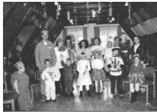
Fasching im Ki Go