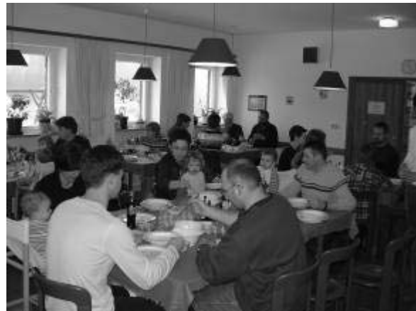
und Guten Appetit