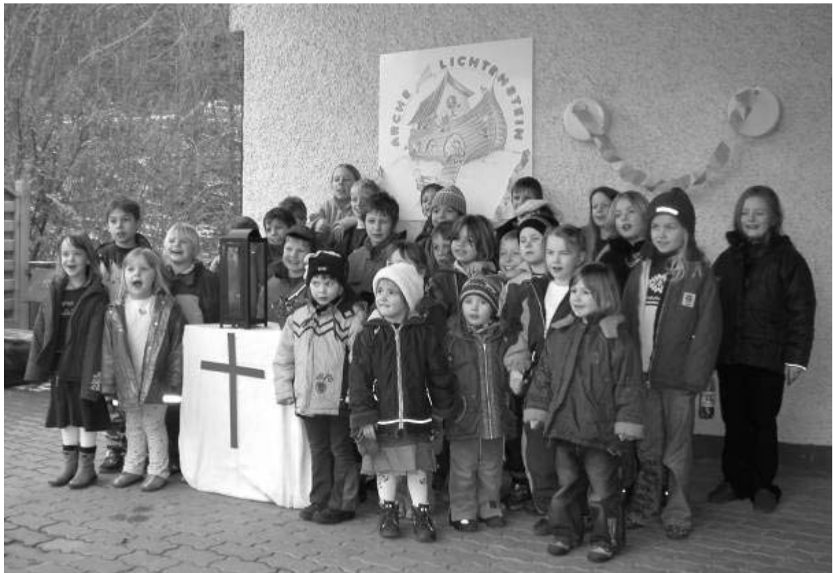
Namensgebung „Arche Lichtenstein“

Sind Sie neugierig? Dann kommen Sie doch einfach vorbei. Wir freuen uns darauf.