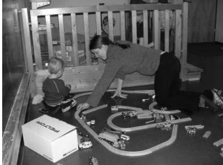
Basteln zusammen macht mehr Spaß, Choof choof choof, Toff tuff tuff die Eisenbahn oder wer beschäftigt wen ?