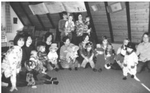
Fasching im Minitreff